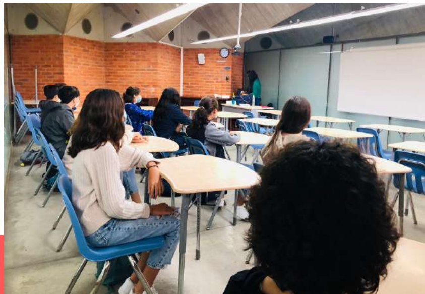
Le port de l'uniforme a été rendu obligatoire pour les collégiens, de la 6ème à la 3ème.

Et bien sûr, les parents également trouveront toujours réponses à leurs questions et leurs doutes au sein de notre service.