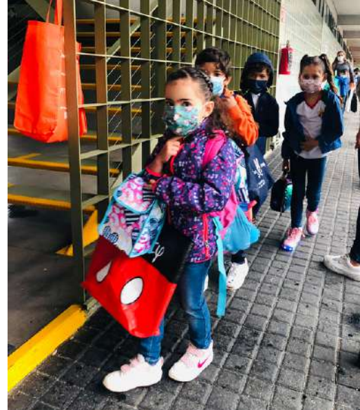
Ouverture de la prérentrée du primaire.

Les professeurs se sont réunis pendant 2 jours pour préparer la rentrée, mettre en place une vraie pédagogie de l'oral qui nous aidera à minimiser et, nous l'espérons, effacer les possibles lacunes d'une scolarisation à distance qui fût difficile pour certains élèves.