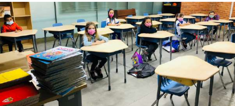
548 alumnos en persona y 41 a distancia.

Actualmente estamos atendiendo a 584 alumnos en persona y 41 a distancia en preescolar y primaria. ¡Es la primera vez que recibimos a tantos alumnos en el colegio desde el inicio de la pandemia!