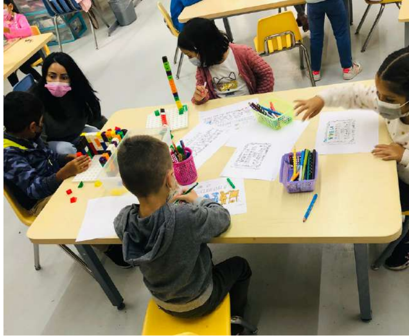
Vie scolaire de la maternelle

Vous êtes tous les bienvenus ! Les élèves qui reviennent après les vacances d'été, ceux qui reviennent après un long isolement, ceux qui reviennent dans notre chère école après une séparation, et bien sûr tous ceux qui sont nouveaux dans notre communauté, nous vous accueillons à bras ouverts !