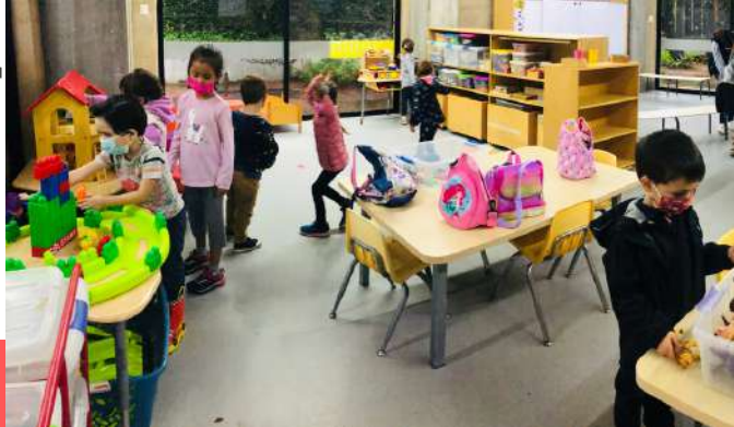
Apertura de la "prérentrée" de preescolar y primaria.

Directora 1er grado / Directrice 1er degré