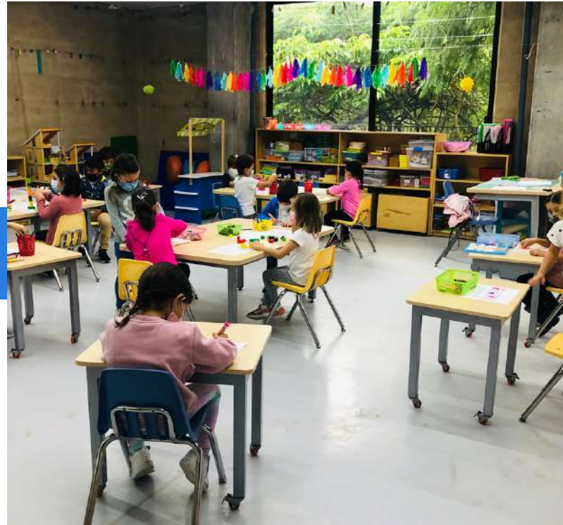
Vida escolar de la maternal

Gracias a todos ustedes padres de familia que han sabido encarar el reto de este regreso a la rutina que tanto anhelamos durante meses y meses. Les propongo sigamos trabajando juntos para solo mejorar. Con un poco de tiempo, el ritmo volverá a instalarse y podremos disfrutar. Cuidémonos, respetemos los protocolos de seguridad y mantengamos esa comunicación abierta.